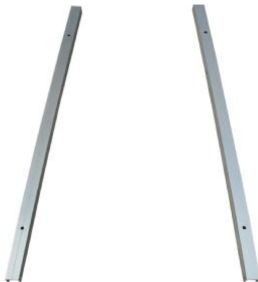
Fig 1.2 stojky